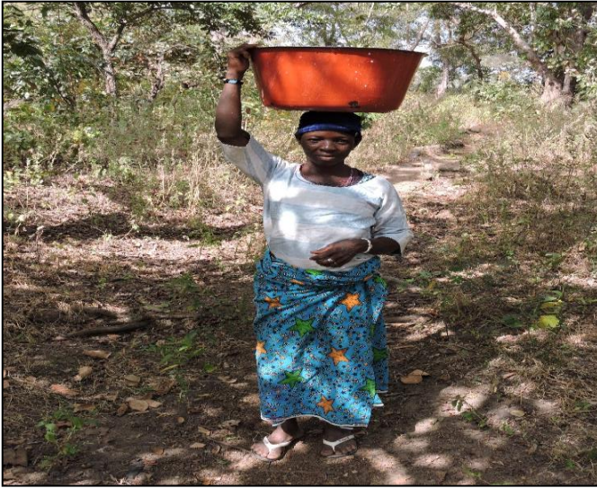
Une femme revenant de la source avec son