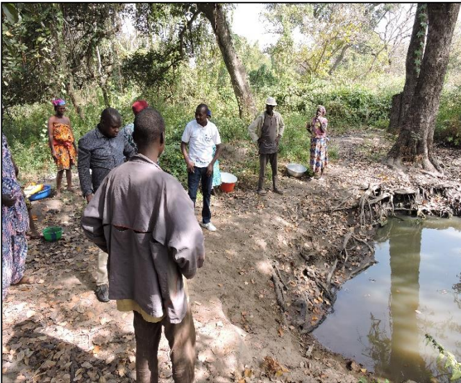
Source d'eau actuelle