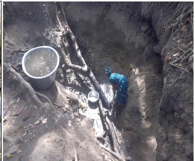
Source d'eau actuelle

En 2019, grâce à l'appui du Centre for Bioresources Sustainability in Africa (CBSA) de Genève et association Palmier, il a été réalisé une étude sur la faisabilité de l'installation des 2 pompes et des latrines pour la population dont voici : « RAPPORT DU PROJET D'ETUDES GEOPHYSIQUES D'IMPLANTATION DE 02 FORAGES EQUIPES DE POMPES A MOTRICITE HUMAINE ET DE FAISABILITE DE TOILETTES PUBLIQUES A DAMA GAH DANS LA COMMUNE DE PARAKOU AU BÉNIN ».